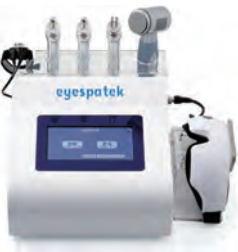
プロ用アイケア専用機器 eyespatek