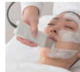
④スクライパー クレンジング