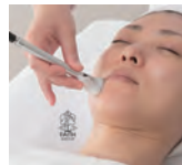
③エレクトロ クレンジング